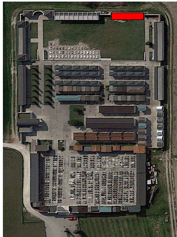
CIMITERO DI BOJON